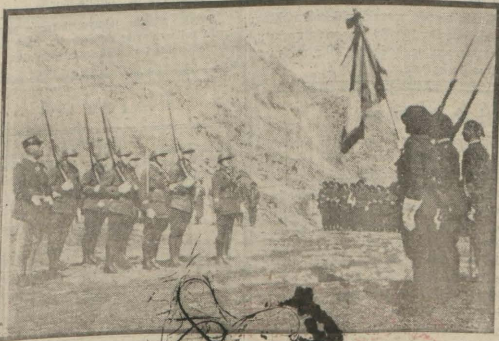
Alplerde Fransız ve İtalyan askerleri karşı karşıya

4 İtalyan sübayı ve 100 er esir edildi, Romada İtalyan topları bir evi hasara uğrattı