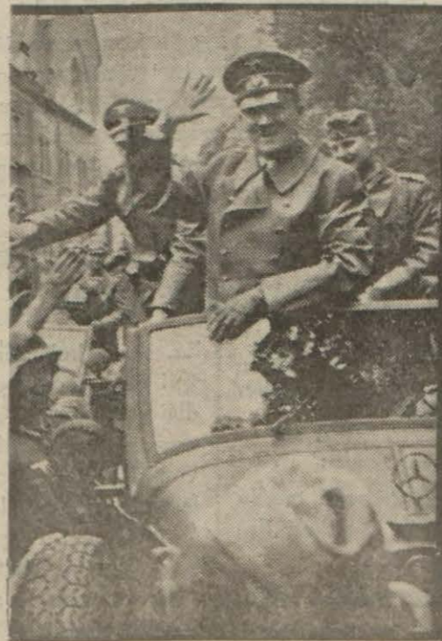
Hitlerin Alman mecmualarında çıkar- ılan son resmi

İngilizler "Hitler şikârlarını hep böyle avuttu,, diyo"