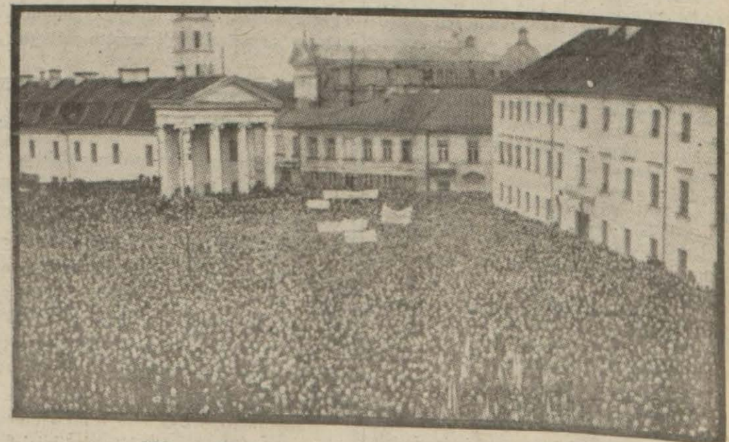
Vilnoda bir nümeyiş esnasında alman bir resim

Londra 15 (Hususi) — Sovyet hükû- meti, Litvanya hükûmetine bir nota vere- rek, Litvanyanın diğer Baltık devletleriyle anlaşmalar akdetmek üzere bulunduğunu ve bu hareketin Sovyet - Litvanya anlaş- (Devamı 3 üncü sayfa)